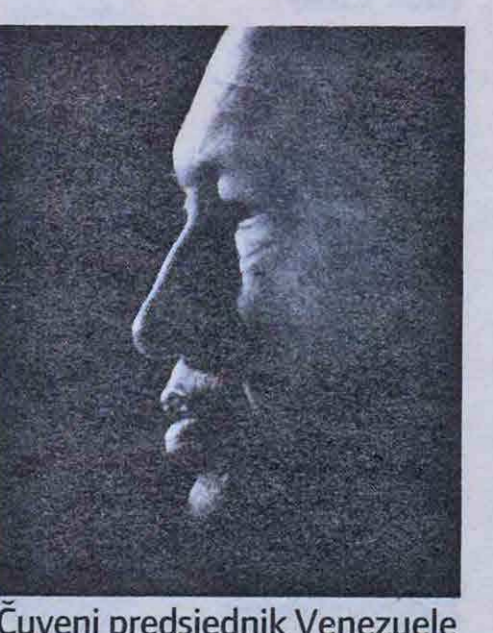
Čuveni predsjednik Venezuele

Zaklinjem se u ime potpune odanosti komandantu Hugu Chavezu da ćemo braniti Bolivarski ustav, čvrstom rukom slobodnih ljudi – izjavio je Maduro prilikom prisige koja je okončana velikim vatrome-